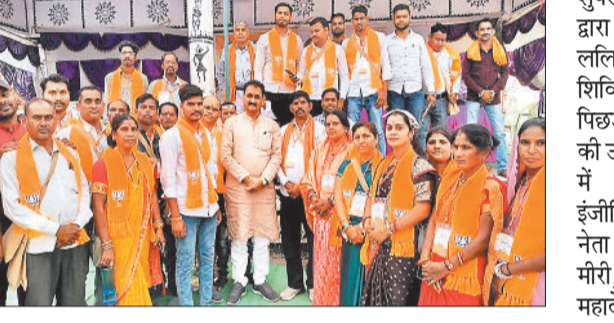
प्रशिक्षण में उपस्थित भाजपा पदाधिकारी एवं कार्यकर्ता।

■ भारतीय जनता पार्टी ग्रामीण मंडल का दो दिवसीय प्रशिक्षण सम्पन्न