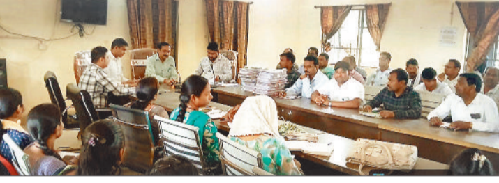
जानकारी देते एसडीएम एवं उपस्थित सरपंच, रोजगार सहायक, समूह के अध्यक्ष एवं शाला के प्रधान पाठक।