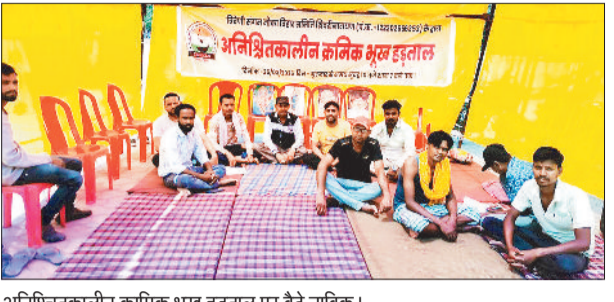
अनिश्चितकालीन क्रमिक भूख हड़ताल पर बैठे नाविक।

जपत नावों को वापस करने एवं बिना किसी रोक टोक के नावों को संचालित करने की मांग को लेकर नाविकों के नवगठित संघ द्वारा क्रमिक भूख हड़ताल किया जा रहा है। उनका भूख हड़ताल सोमवार 30 मार्च को भी जारी रहा। नाविक संघ ने नगर पंचायत के अध्यक्ष एवं सीएमओ पर आरोप लगाया कि उनके द्वारा दुर्भावनावाश कुछ चुनिन्दा नावों को जबरन जब्त किया गया है।