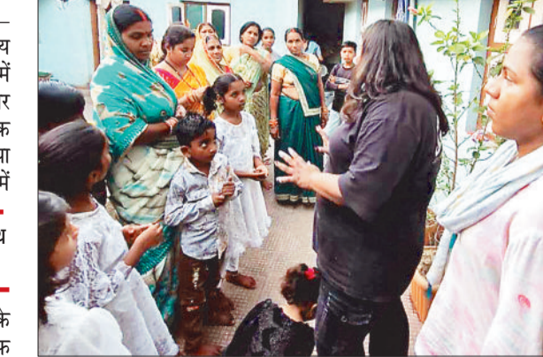
ग्रामीणों को जागरूकता का संदेश देते स्वयंसेवक।

राष्ट्रीय सेवा योजना के सात दिवसीय विशेष शिविर के अंतर्गत ग्राम बनारी में स्वयंसेवकों द्वारा सेवा, स्वच्छता और सामाजिक उत्तरदायित्व से जुड़ी अनेक गतिविधियों का सफल आयोजन किया गया। पूरे दिन चले कार्यक्रमों में